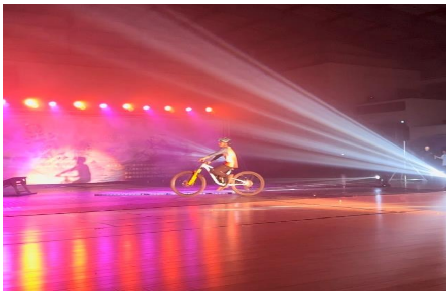
師長與學生共同表演