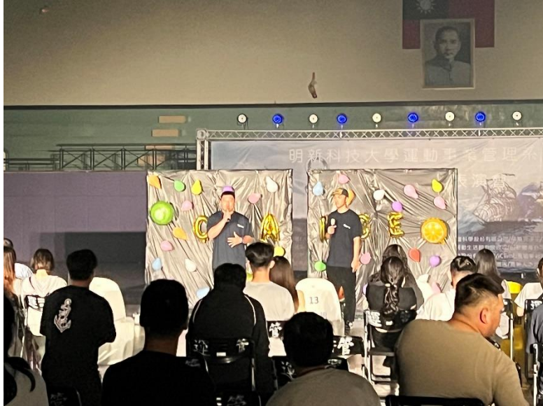
活動司儀-大一大三生