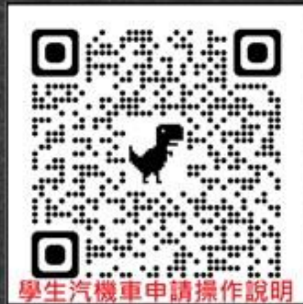
學生汽機車申請操作說明