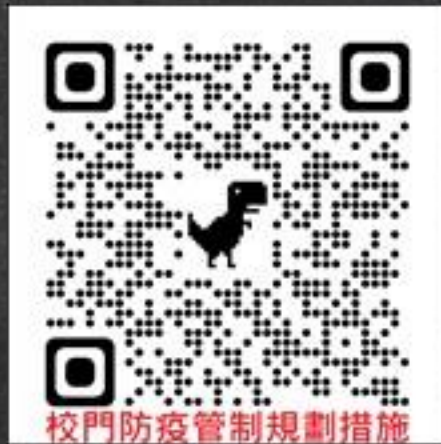
校門防疫管制規劃措施