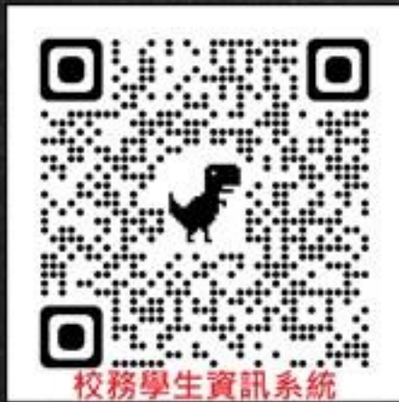
校務學生資訊系統