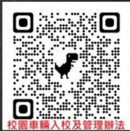
校園車輛入校及管理辦法