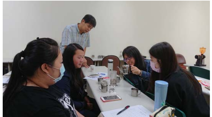
學生手沖咖啡練習